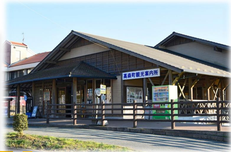
写真 G-ZERO 岳習館