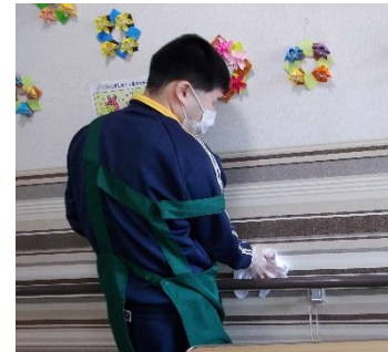
B型のご利用者が特養で清掃している様子

尚仁福社会 法人本部 〒689-4403 鳥取県日野郡江府町大字久連7番地 TEL 0859-72-3210 URL http://syoujin.or.jp/