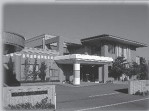
・ケアハウスフローラ