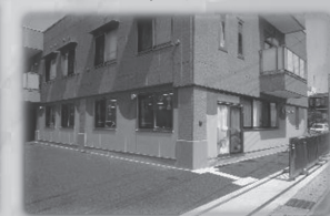
・科の木 ・ころぼっくるの森保育園