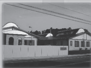
・フローラもぼら