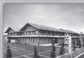
・フローラりんくる